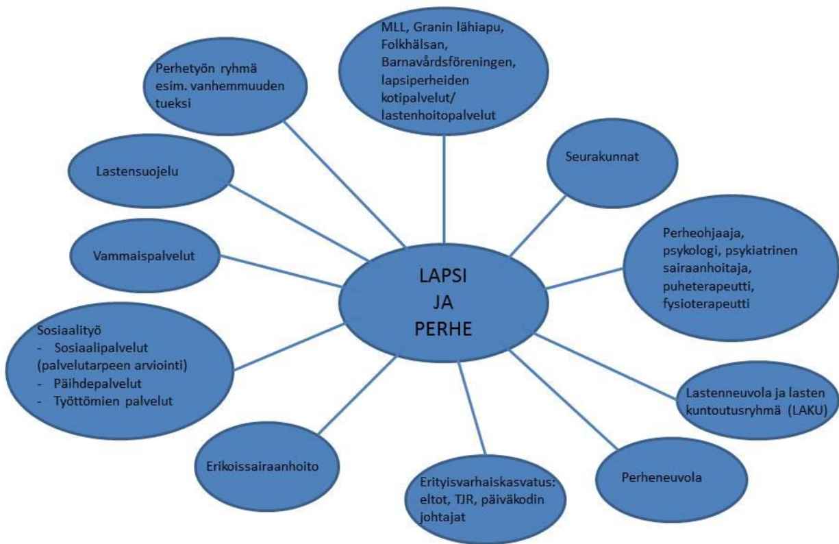
Kuvio 1: Monialainen yhteistyö tuen aikana.