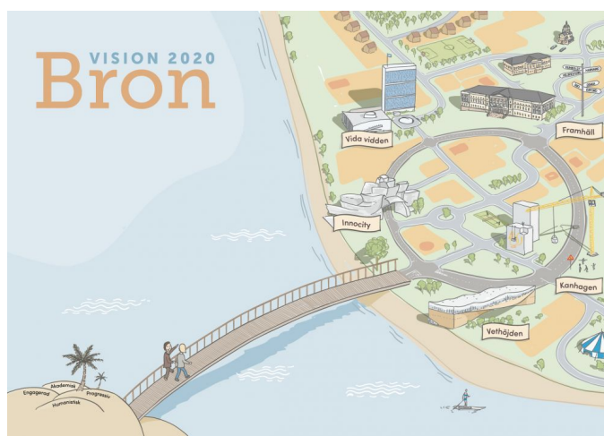
Skolans vision Bron 2020

Under läsåret 2020–2021 utarbetas en ny vision som tar avstamp i Bron 2020.